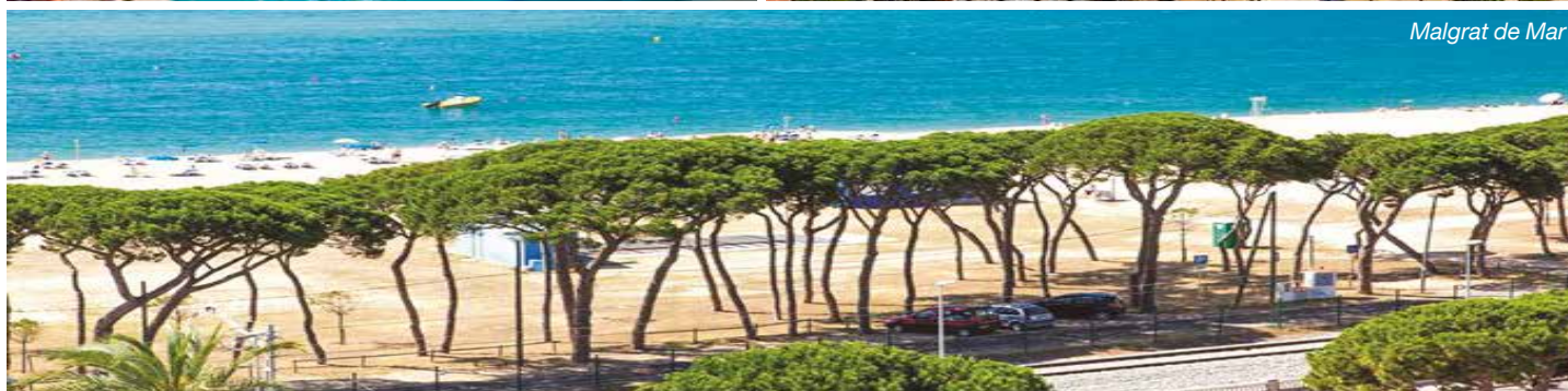
Malgrat de Mar