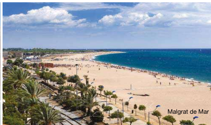
Malgrat de Mar